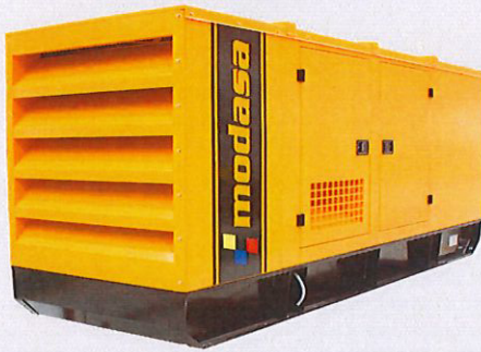
GRUPO ELECTRÓNICO INSONORO